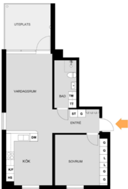
3 rum o kök 72 kvm