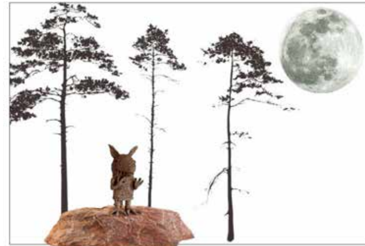
SKISS SCENOGRAFI 'GÅRD 1'

De två gårdarna har var sin bod där fasaderna bildar som ett scenrum, för att bygga en miljö och kontext har jag använt mig av två innergårdsväggar för att skapa en scenografi/stämning för berättelsen eller kanske sagan figurerna är tänkta att interagera med sina betraktare, kommunicera och aktiverka fantasin är i storleken som förskolebarn ca 90 cm höga för att vara lite förunderligt stora och i ögonhöjd för 'samtal.' och interaktion, också fint att komma nära om man sitter i rullstol eller behöver rullator. Alla material i verket är tänkta att åldras med patina och bli vackrare över tid, corten, brons och natursten.