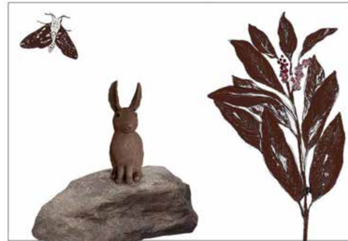
SKISS SCENOGRAFI 'GÅRD 2'

3D OCH 1:10 MODELL BARNENS GÅRD- SKAPA NYFIKENHET, SPÄNNANDE, ÄVENTYR, UPPTÄCKARLUST, HUMOR.